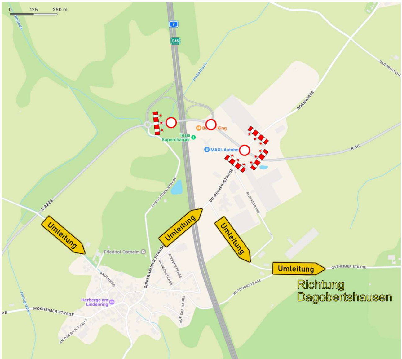
Bauabschnitt 1 und 2 inkl. offiziell geplante Umleitung [Apple Maps]